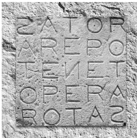
图 1 Sator Square(萨托魔方阵)

“信条”组织的手势也在影片中多次出现。男主的长官,军火贩普利亚,多次拯救男主的尼尔都做出过该手势。手势为两手重合,十指交接在一起。这不仅寓意着电影里的时间是交叉咬合,互相背逆的,也暗示了“信条”组织把时间掌控在自己手里的原则。